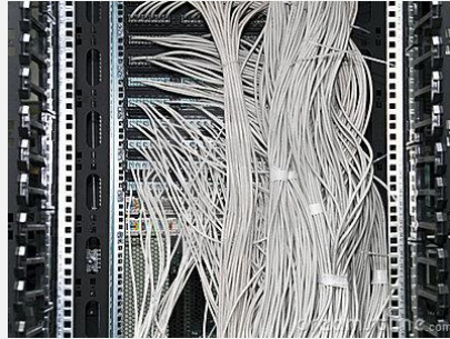
Laboratórios Oficiais CISCO