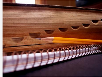
Sessões de dúvidas (6 horas)